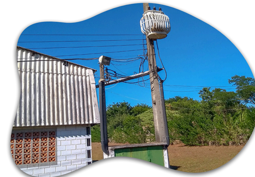
Clientes tipo média ou alta tem transformador próprio

1 Indicações só serão validadas e terão comissões pagas após avaliação do especialista indicando que o mercado livre de energia é viável.